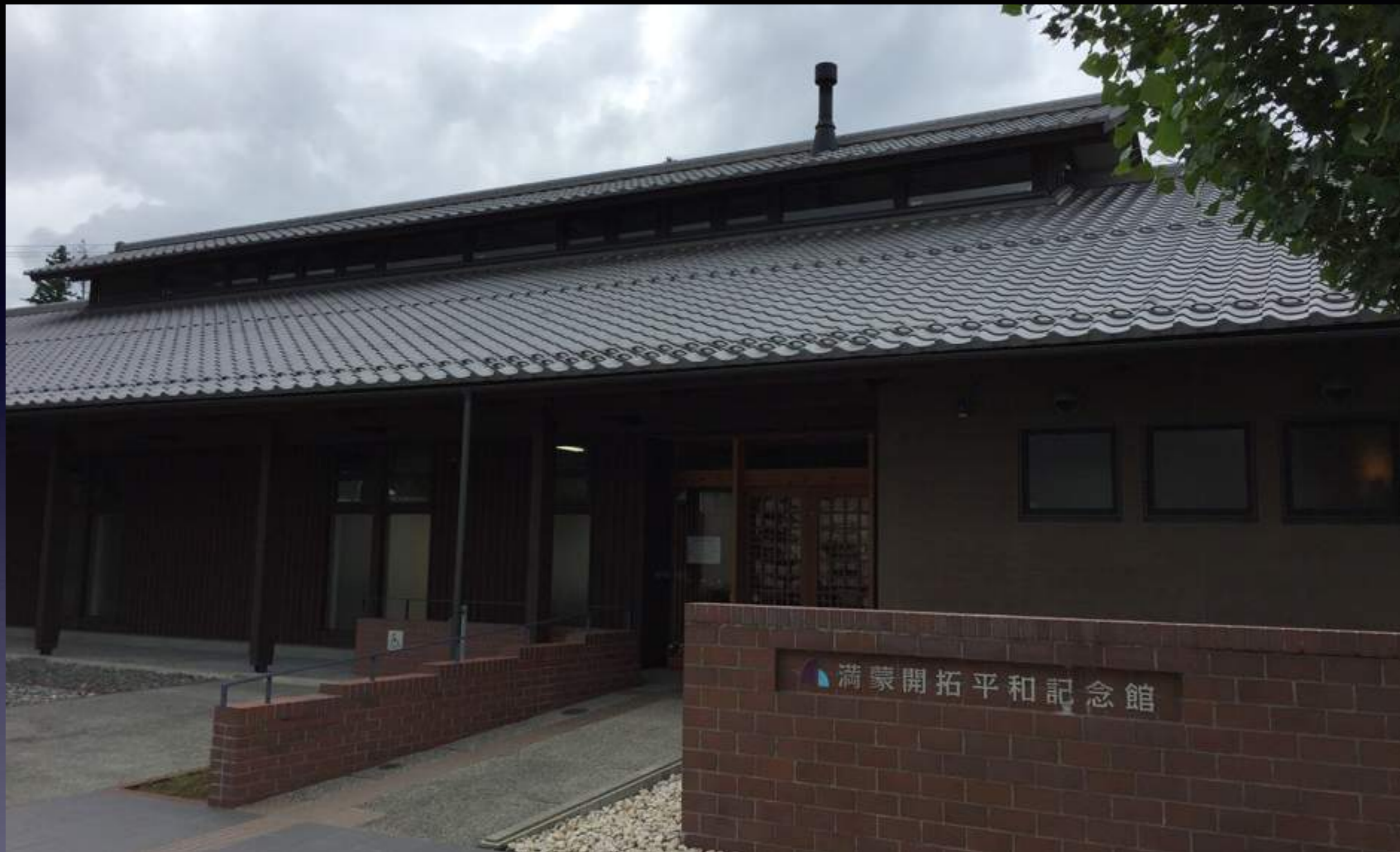
満蒙開拓平和記念館